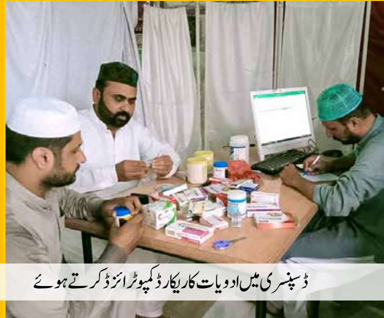
ڈسپنسری میں ادویات کا ریکارڈ کمپیوٹر انڈکس کرتے ہوئے