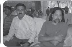
میں نے انگریزوں کو شکریہ ادا کیا ہے