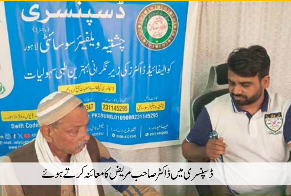
ڈسپنسری میں ڈاکٹر صاحب مریض کا معائنہ کرتے ہوئے

ہر اتوار کو 3 بجے سے 5 بجے تک فری ڈسپنسری میں مریضوں کا علاج کیا جاتا ہے اور ادویات دی جاتی ہیں۔