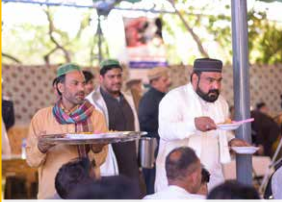
تقریب میں مہمانوں اور ضرورتمند افراد میں کھانا تقسیم کرتے ہوئے