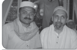
کامیابی کا یہ سہرا ہے

کیم مئی کے موقع پر ڈونر کانفرس کی تقریب میں میڈیا سے گفتگو کر رہے ہیں۔