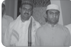
الحمد لله رب العالمين