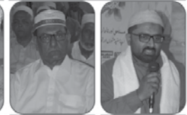
میں نے کے لئے