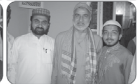
۱۴۸۵ء میں مرگئے۔