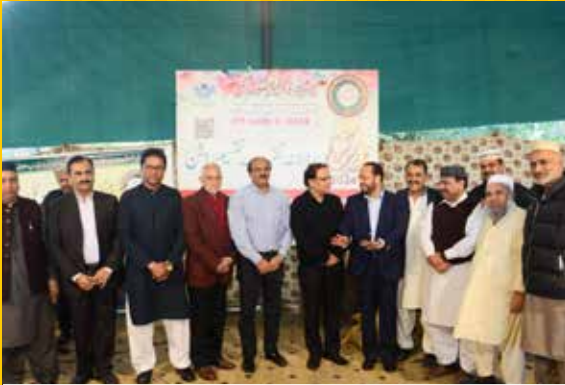
مہمان خصوصی تقریب میں شریک ہیں