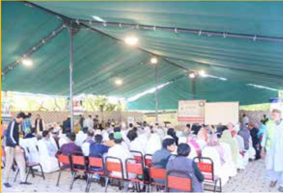
حقدار افراد تقریب میں شریک ہیں