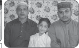
دود لعل سجاد علی