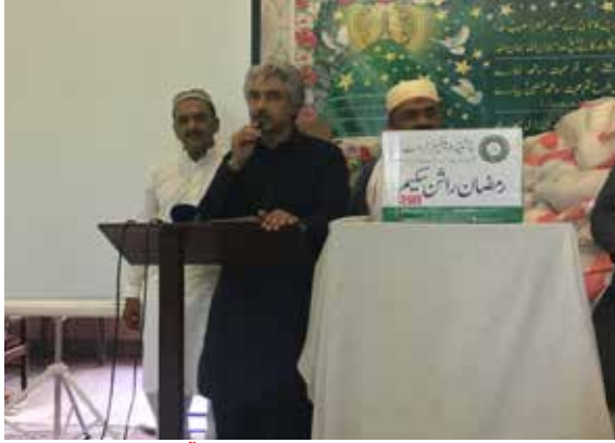
چشتیہ ویلفیئر سوسائٹی کی جانب سے سالانہ رمضان راشن تقسیم تقریب میں صوبائی وزیر صنعت و تجارت میاں اسلم اقبال صاحب تقریب سے خطاب کر رہے ہیں۔