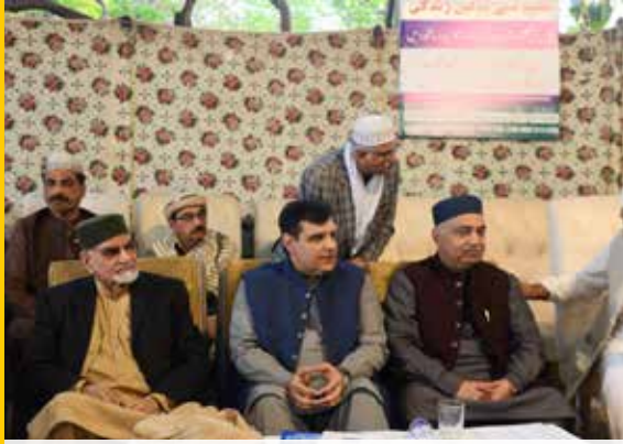
تقریب کے روح رواں و انتظامیہ کمیٹی ممبران شریک ہیں