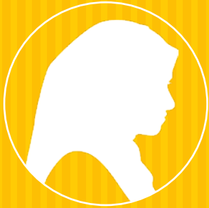
Tehseen W/o Faisal Bilal Social Worker