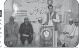
ایسی پھر اچھ سے غریب سے خطاب کر رہے ہیں